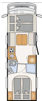
I 7150-2 DBL