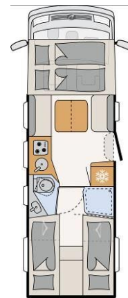
I 7150-2 EBL