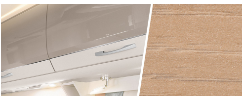
+ Trædekor Noce Nagano