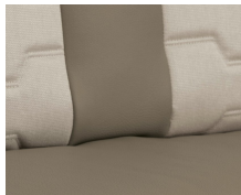
+ Stofkombination Nubia ○