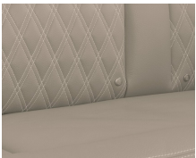
+ Rubino læder ○