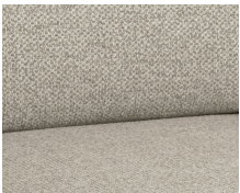
+ Stofkombination Kari