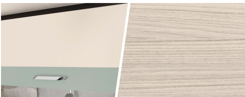
+ Trædekor Tindari Bora