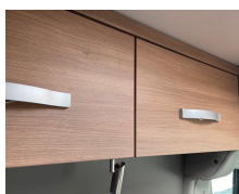
+ Trædekor Cape Town