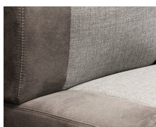
+ Stofkombination Hygge