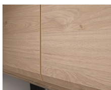
+ Trædekor Noce Nagano