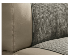
+ Stofkombination Camino