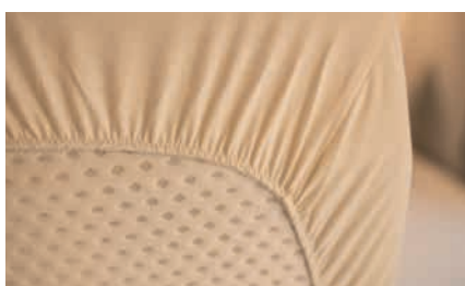
» Koldskumsmadrasser til alle faste enkelt- / dobbeltsenge