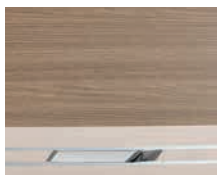
+ Sambesi Oak