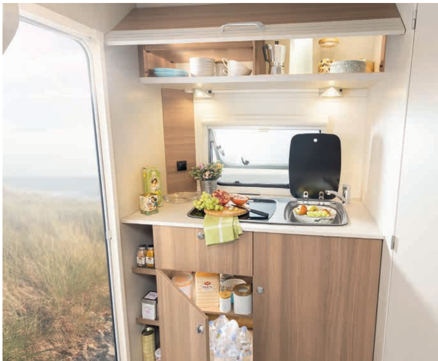
» Rummelige køkkenoverskabe