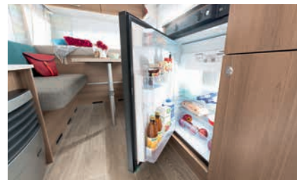
» Rummeligt køleskab med 81 l volumen og 10 l frostboks (afvigelser - se tekniske data for de enkelte modeller)