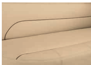
+ Skylight (ægte læder, ekstraudstyr)