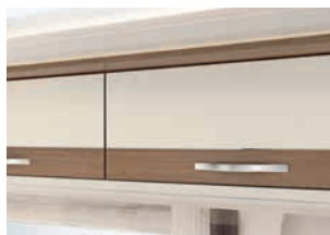
+ Virginia Oak (eg)