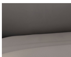
+ Collin læder *