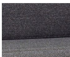
+ Stofkombination Melia *