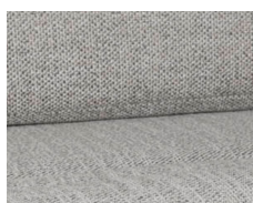
+ Stofkombination Samir