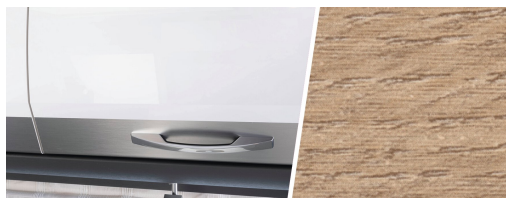
+ Trædekor Amberes Oak