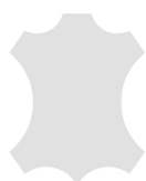
+ Individual læder (på forespørgsel) *